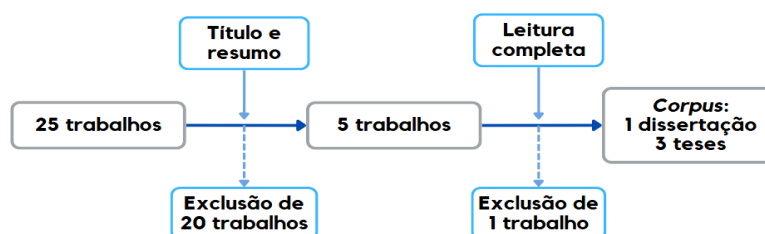
Figura 2 - Síntese do procedimento empregado na busca e seleção dos trabalhos

Foram lidos títulos e resumos de 25 trabalhos e, quando não foi possível identificar, por meio da leitura de título e resumo, se o trabalho atendia aos critérios supracitados (a - c), procedeu-se à leitura na íntegra para avaliar sua inclusão. Após esse movimento de busca e seleção, o corpus foi definido e constituído pelas pesquisas desenvolvidas por Bego (2017), Ferrarini (2020), Alves (2023) e Alves (2024). Todas essas pesquisas estão apresentadas na seção de referências deste artigo. Na Figura 2, sintetizamos o movimento de busca realizado no CTD e no PP da Capes.